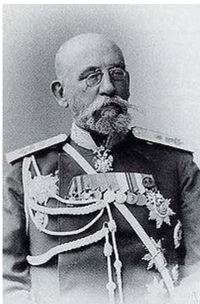
Foto på Nikolaj Ivanovitj Bobrikoff