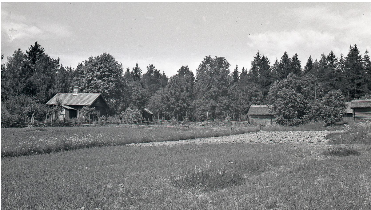
Ekhagen vid min fader Ernfrids återbesök 1938